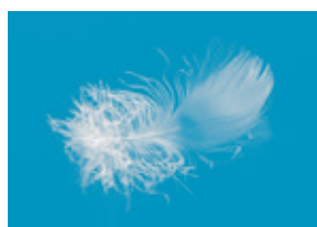
Piumette con peluria