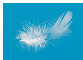
Plumettes de canards